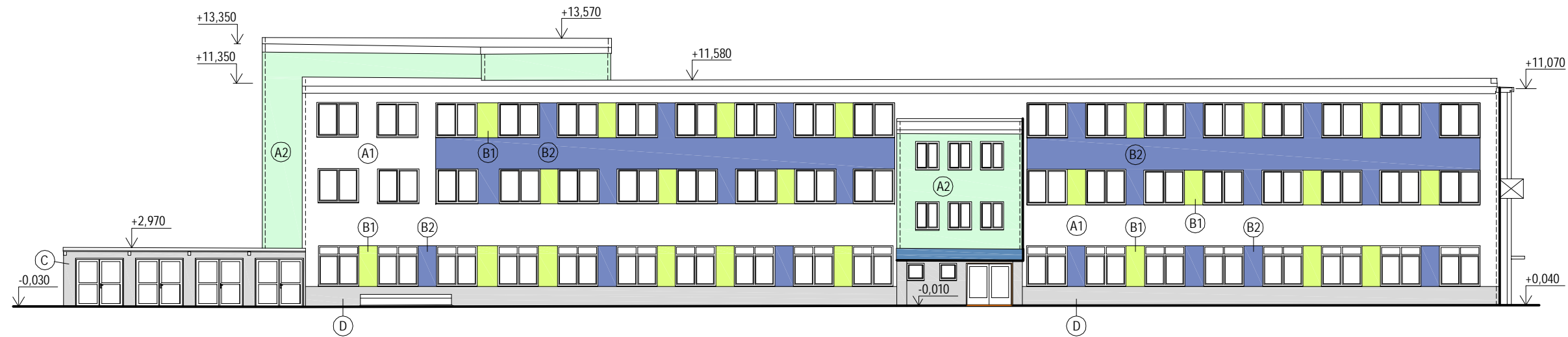
vizualizace - severovýchodní pohled - administrativa